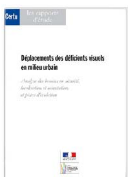
Éditeur : Certu (janvier 2009) ISSN : Certu/RE--08-31--FR ISSN : 1263-2570 28 pages en téléchargement gratuit