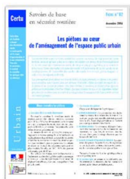
Éditeur : Certu (décembre 2008) en téléchargement gratuit Versions française et anglaise